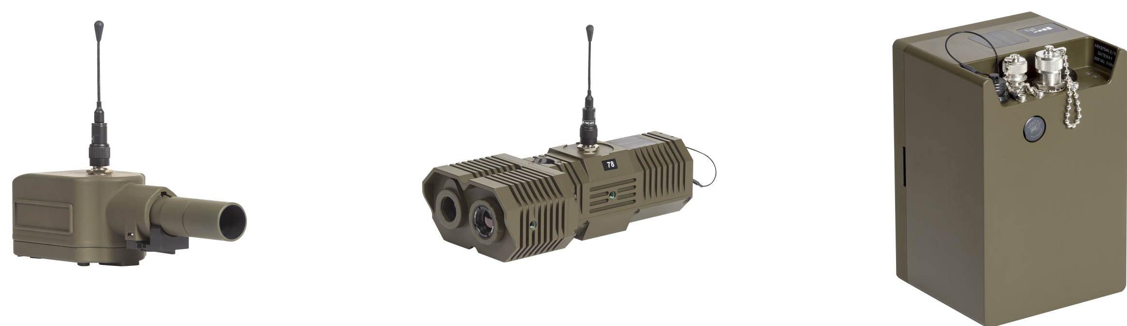
Figur 1: Enheterna från systemet som applikationen testar. Från vänster till höger är det PIR, Scout och Gateway.